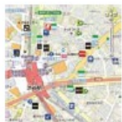
※マッピングされたMAP