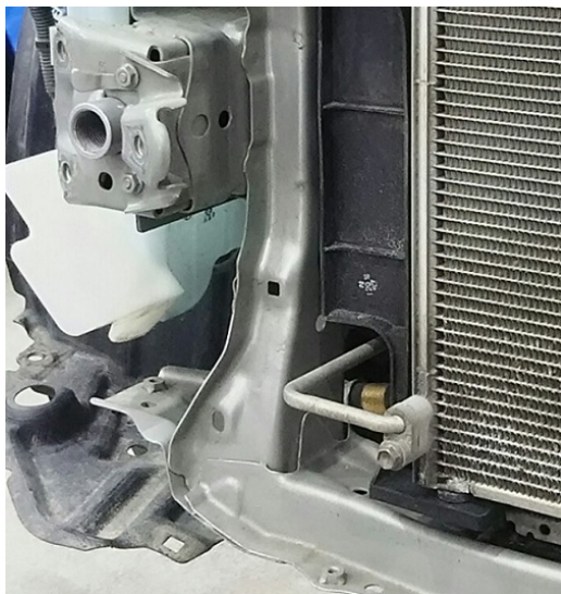
フロントクロスメンバー右側部拡大

アクア (NHP10) は、サイドメンバー内側にあるラジエータコアサポートを介して間接的にクロスメンバーが接続されています。そのため、上記赤枠囲み部分のクロスメンバーに損傷や交換があった場合でも修復歴となりません。